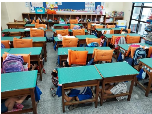
地震防災宣導：趴、掩、穩