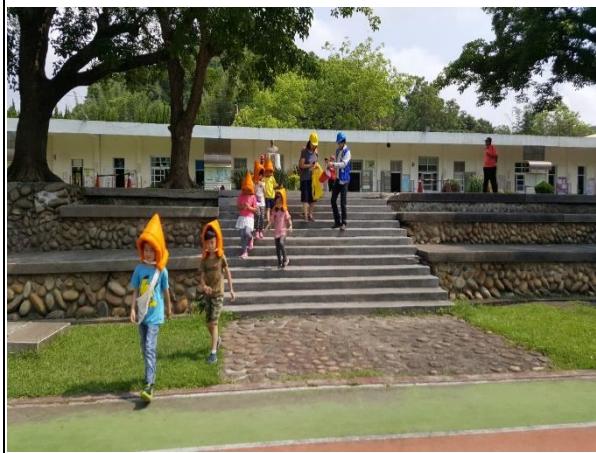
頭帶掩護物，保護頭頸部遵守不推不擠不語進行疏散