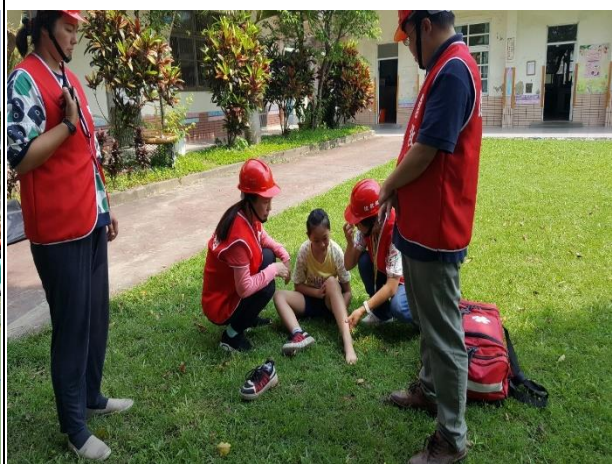
進行傷患救傷處理