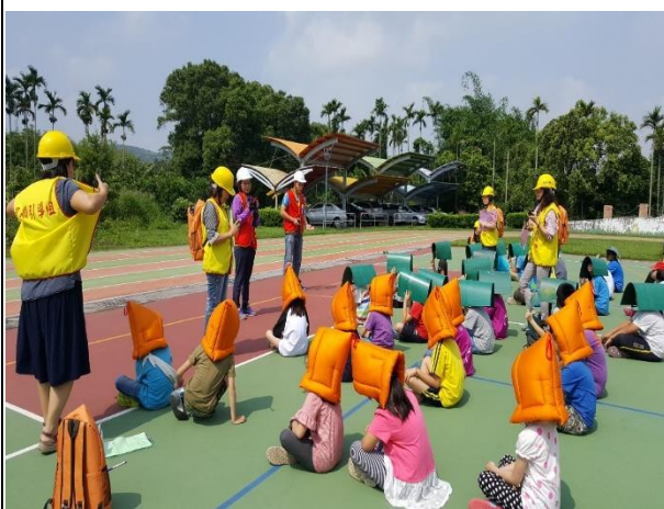
疏散避至難集合點